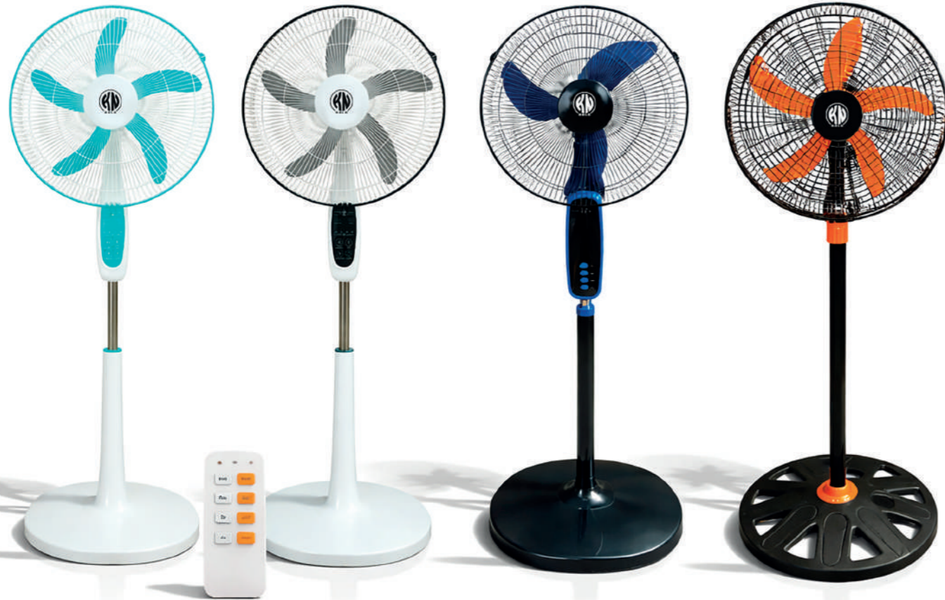
Abanico de Pedestal Digital Táctil Verde, Negro 18"